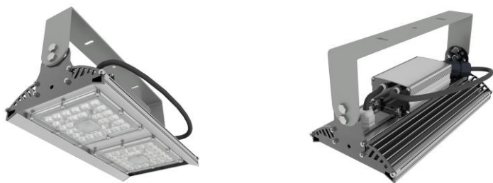
Рис. 1. Светильник ProLedSystem LEW-60